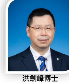
洪劍峰博士 創辦人及主席 萬保剛集團有限公司 (SEHK: 1213)